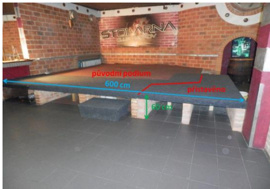
*foto1 pódium zepředu