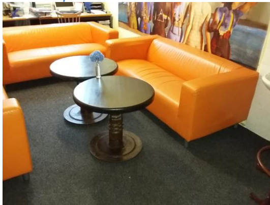
*foto5 2.šatna vstup